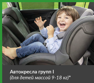
Автокресла групп I (для детей массой 9-18 кг)*