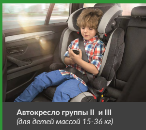
Автокресло группы II и III (для детей массой 15-36 кг)